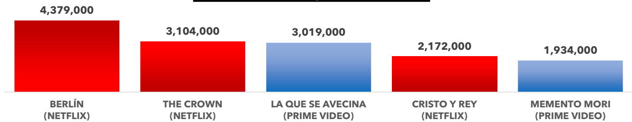
TOP 5 Series en espectadorre únicos

Cambio radical en el Top 5 de series más vistas en todas las plataformas en diciembre. El estreno de la producción española 'Berlín' se hace con el puesto número 1 al conseguir un total de 4.3 millones de espectadores únicos en el mes. Le sigue lo nuevo de 'The Crown' en Netflix que sube hasta los 3.1 millones de espectadores únicos. Tercera opción para la serie nacional 'La que se avecina' en Prime Video con más de 3 millones de espectadores únicos.