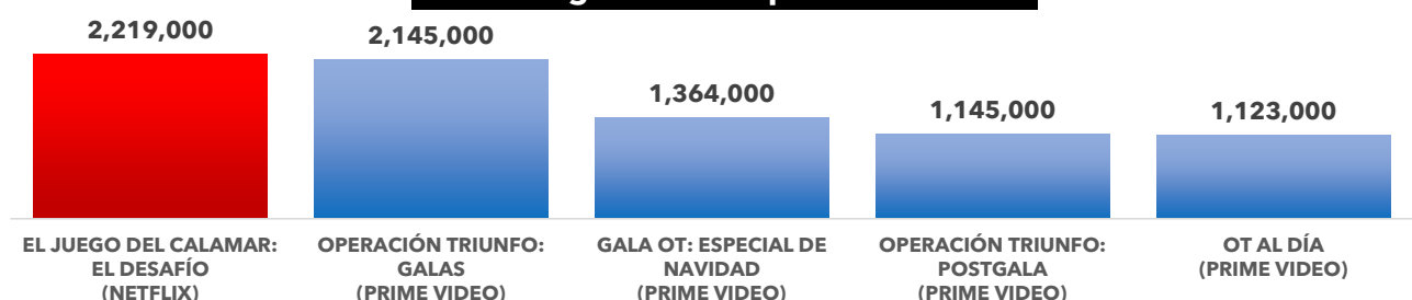
TOP 5 Programas en espectadorre únicos

'Operación Triunfo' acapara casi en su totalidad el Top 5 de programas más vistos en plataformas en diciembre de 2023. Las galas de OT alcanzan el diciembre más de 2.1 millones de espectadores únicos, mejorando el dato del mes de noviembre. Sin embargo, el reality 'El juego del calamar: El desafío' de Netflix es el programa más visto de diciembre con más de 2.2 millones de espectadores únicos.