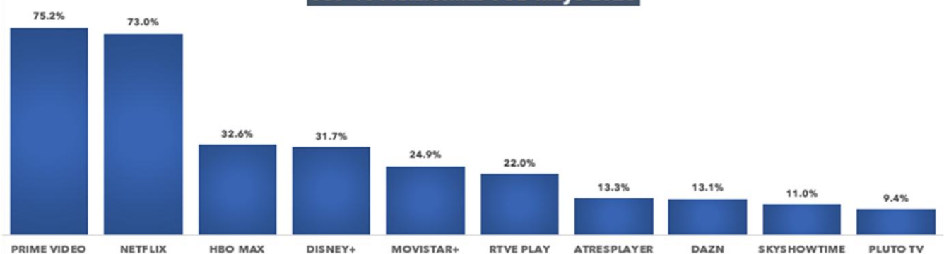
TOP 10 Plataformas VOD Mayo 2026

La plataforma gratuita RTVE Play alcanza un 22% de penetración, subiendo un +1.6% respecto al mes anterior.